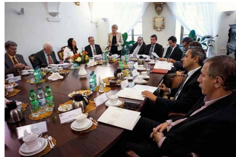
26 IX 2016. W Sali Plafonowej Collegium Maius obradowała Kapituła Honorowa kierunku lekarskiego