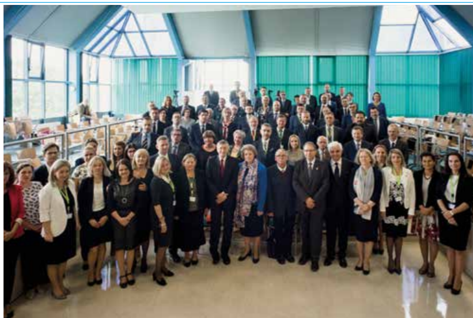
19-21 IX 2016. Zjazd Dziekanów Prawa Publicznych Uczelni polczony był z obchodami dziesięciolecia istnienia Wydziału Prawa i Administracji UO. Na zdjęciu – goście i gospodarze uroczystości