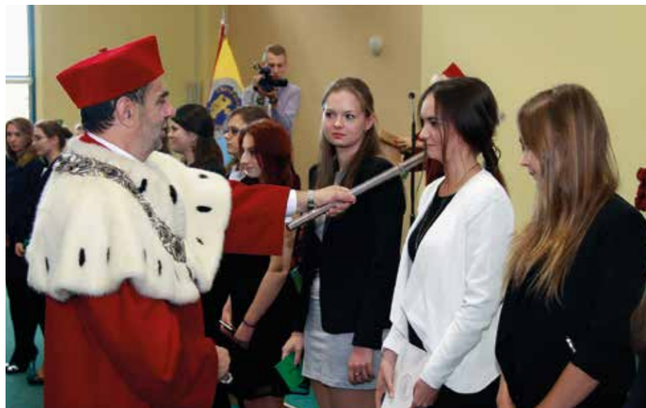
Uroczysta immatrykulacja studentów pierwszego roku