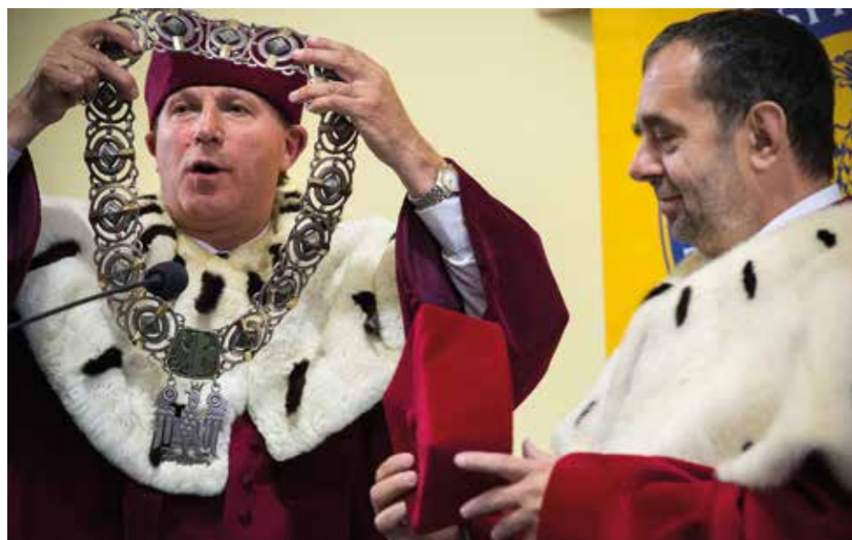
Symboliczne przekazanie insygniów władzy rektorskiej