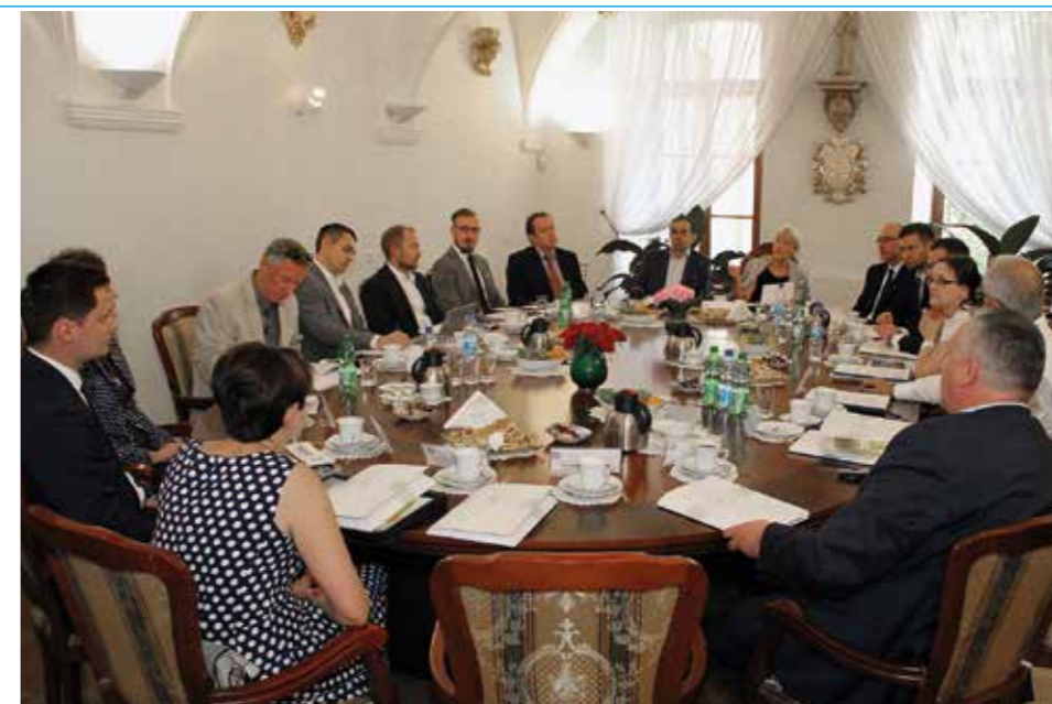
21 VII 2016. Na Uniwersytecie Opolskim odbyło się spotkanie dotyczące powołania o rodka studiów politycznych, dialogu i stosunków międzynarodowych oraz centrum strategii i bezpieczeństwa energetycznego