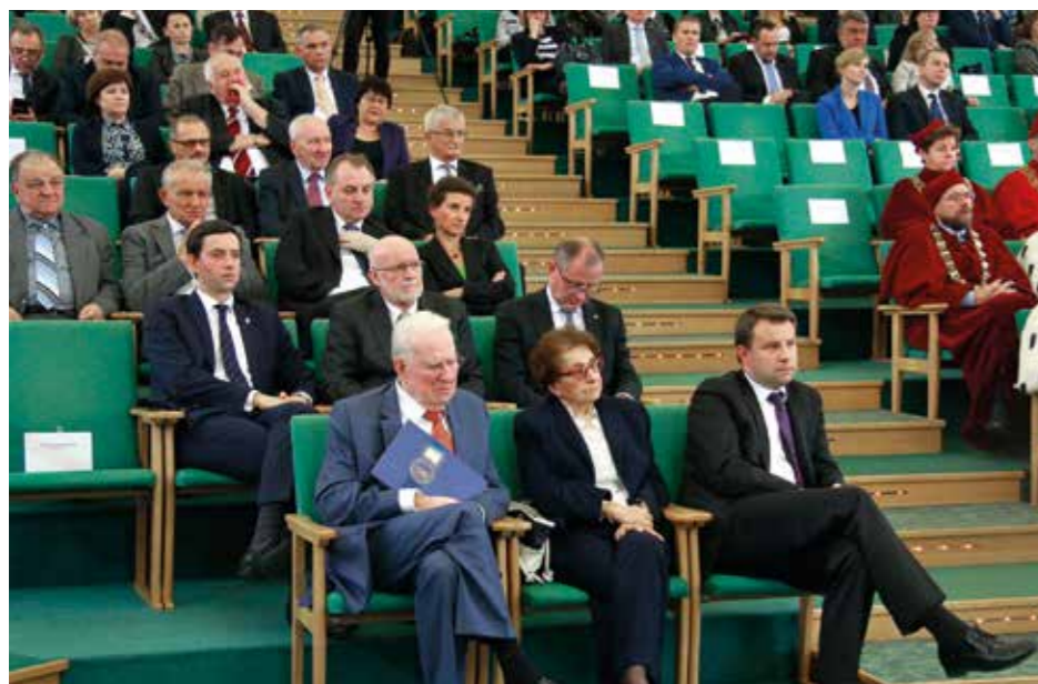
Goście uroczystości

nansowania uczelni. Po to, by skończyć z promowaniem i wyczerpieć liczebność studentów, co skutkuje devaluacją wartości dyplomów, a zacząć promować jako nauczania.